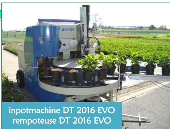
inpotmachine DT 2016 EVO rempoteuse DT 2016 EVO