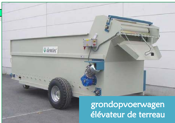
grondopvoerwagen élévateur de terreau