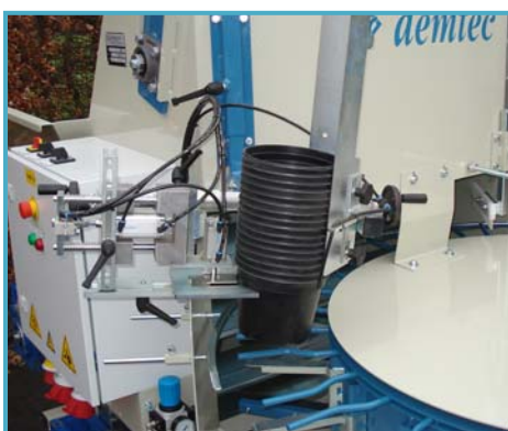
pneumatische pottendoseerder distributeur de pots pneumatique