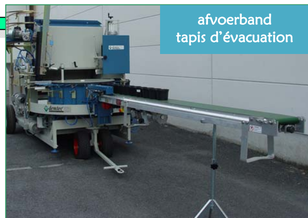
afvoerband tapis d'évacuation