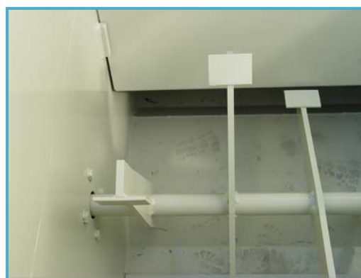
molen in grondbak, automatisch gestuurd broyeur dans bac à terreau, piloté automatiquement