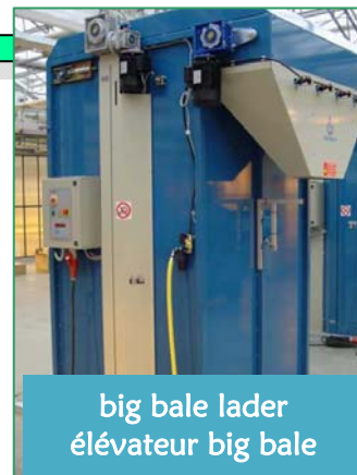
big bale lader élévateur big bale