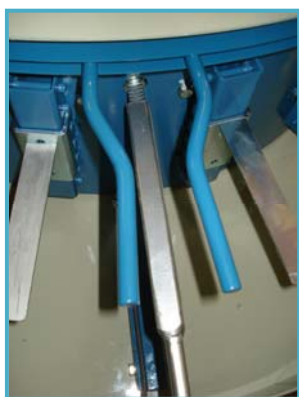
centrale verstelling pottenkranen réglage central des couronnes